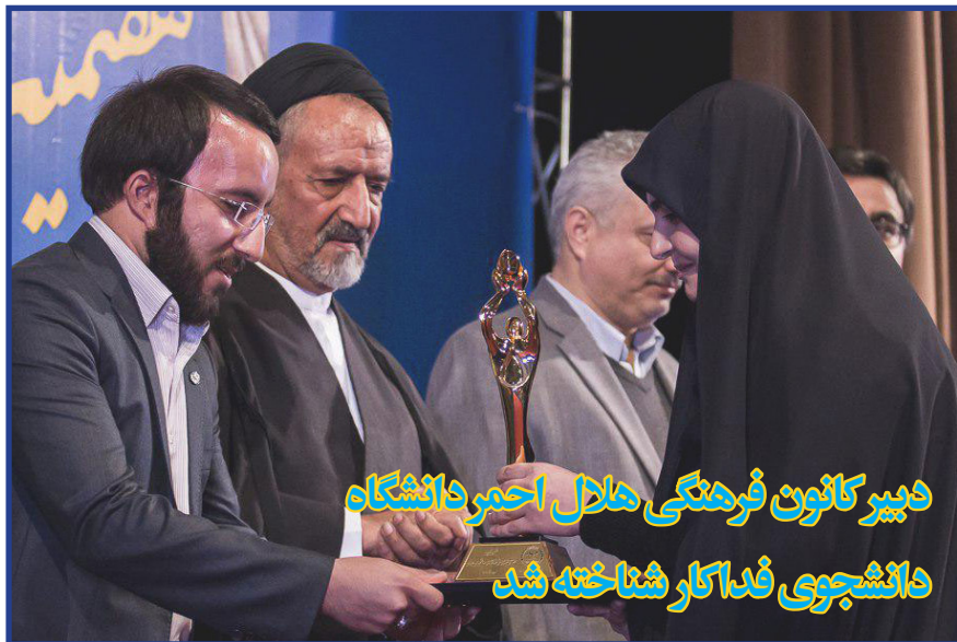
دبیر کانون فرهنگی هلال احمر دانشگاه دانشجوی فداکار شناخته شد

هفتمین دوره آیین تقدیر و اعطای تندیس ملی فداکاری به دانشجویان برگزیده در تالار فردوسی دانشکده ادبیات و علوم انسانی دانشگاه تهران برگزار و دبیر کانون فرهنگی هلال احمر دانشگاه تربیت مدرس به عنوان دانشجوی فداکار کشوری شناخته شد.