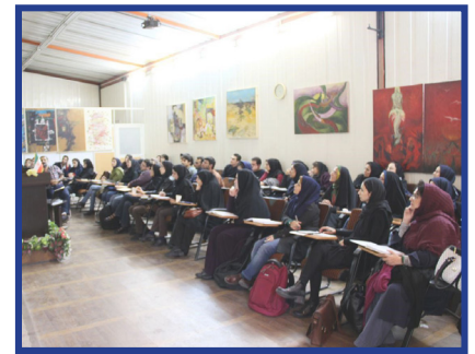
انجمن علمی - دانشجویی هنر اسلامی برگزار کرد: