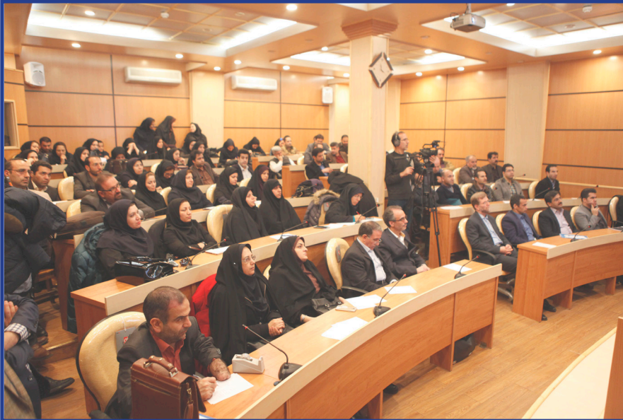
معاونت فرهنگی و اجتماعی با همکاری پژوهشکده اقتصاد دانشگاه برگزار کرد:

معاونت فرهنگی و اجتماعی دانشگاه تربیت مدرس سال اول | شماره نهم | دی ماه ۱۳۹۵